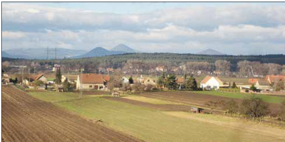
Fotografiemi do tohoto vydání zpravodaje přispěli: