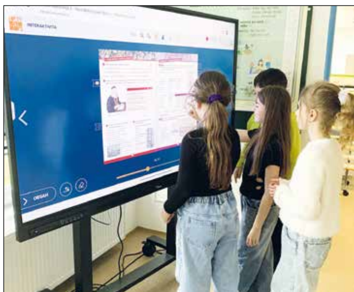
Děti mají k dispozici interaktivní tabuli.