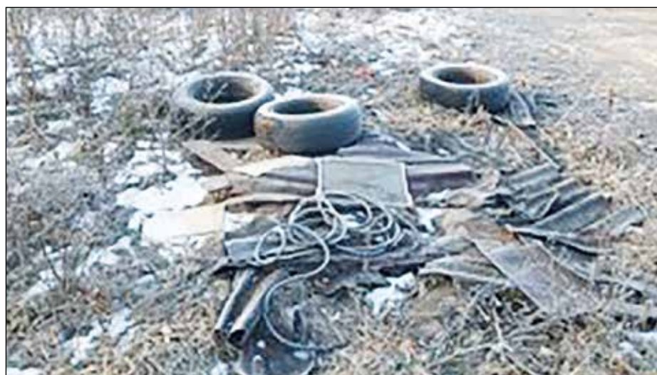
Líbí se vám takové zátíší na cestě k Větlé a nepořádek kolem odpadkového koše...?