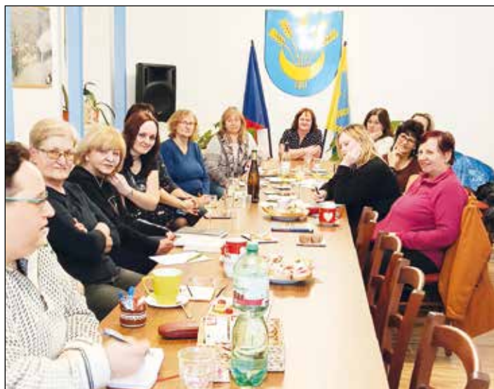
V zasedací místnosti obecního úřadu proběhla beseda