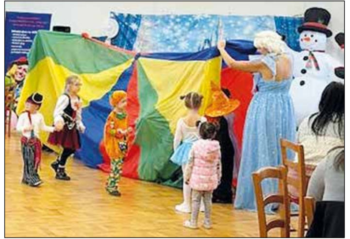
Děti se na karnevalu radovaly o týden dříve než dospělí. I ony si odpoledne pěkně užily s oblíbenými hrdinkami z populárního filmu Ledové království. Tančily, soutěžily a vyhrávaly pěkné ceny.