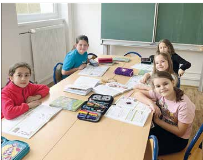
Při učení vládne příjemná atmosféra.