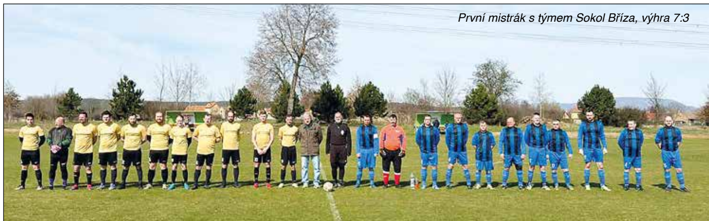
První mistrák s týmem Sokol Bříza, výhra 7:3