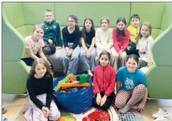
Vztahy mezi dětmi jsou v malotřídce často pevnější.

a podpoře individuality. A právě to jsou oblasti, ve kterých malé školy často vynikají.