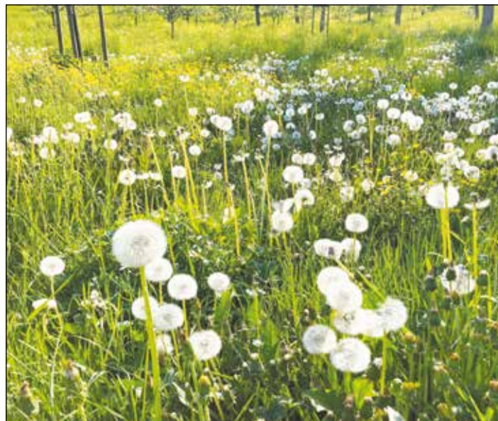
Toužebně očekávané jaro je konečně tady