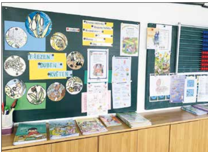
Pěkná nástěnka je ozdobou řídy.

Stojí za to připomenout také dlouhodobé výsledky malotřídního vzdělávání . Ačkoliv to někdy rodiče překvapí, z malotřídních škol běžně vyrůstají lékaři, inženýři, architekti, učitelé, vědci i další úspěšní lidé . Mnoho výzkumů i zkušeností ukazuje, že kvalita vzdělávání nespočívá v počtu tříd, ale v přístupu, bezpečném prostředí