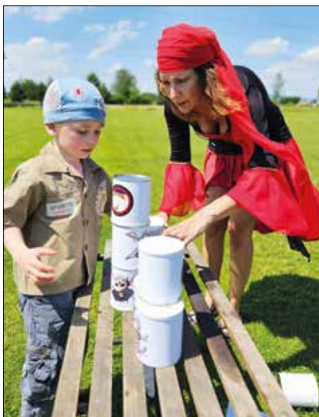
Oblíbené pirátské hrátky