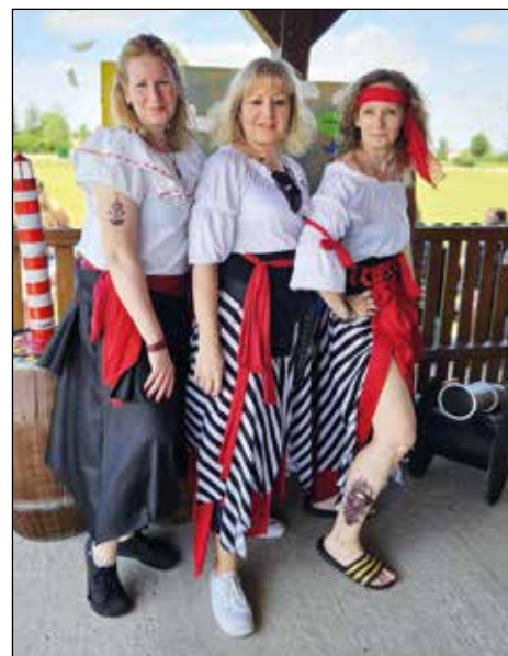
Naše šikovné pirátky