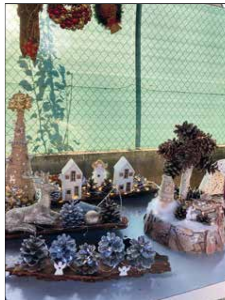
Překrásné vánoční dekorace vytvořili naši šikovní spoluobčané