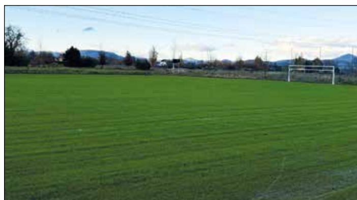
Bude to krásné hřiště