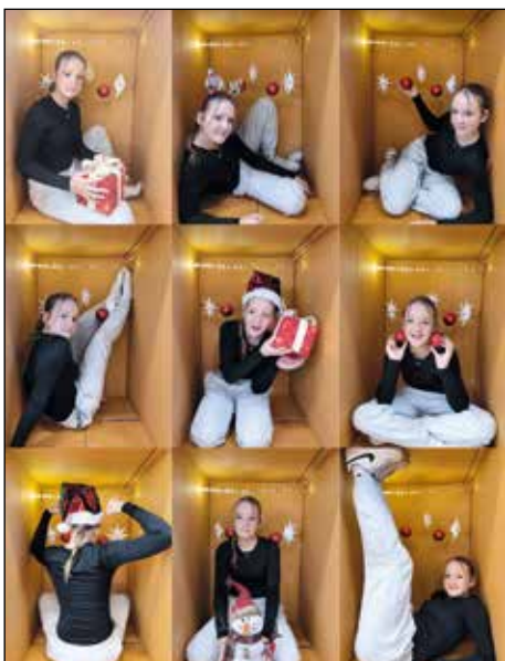
Focení může být legrace