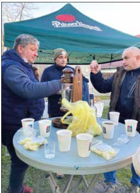
Na zdraví, sousedé