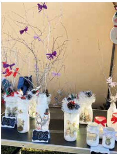
Výzdoba od Aisbrychů i letos zabodovala