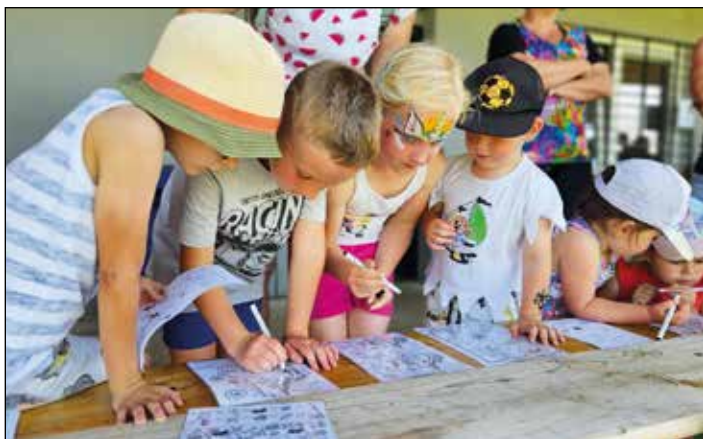
Vzpomínka na horké léto

Letošní akce pro děti se velice povedly. Jsme rády, že se jich účastní čím dál více zájemců. To nám dává zpětnou vazbu, že to, co děláme, má smysl. Do karet asi také hrálo, že se vždy vydařilo počasí. Na jaře si děti prošly již tradiční velikonoční stezku lesem. V červnu jsme prázdniny uvítaly pirátským dnem, kde si děti zasoutěžily, proběhly se v pění a posbíraly si bonbóny, které spadly z nebe. V říjnu proběhlo Strašidlení, kterého se zúčastnilo velké množství návštěvníků – rekordní počet 137 dětí. Strašidlení je naše „srdcová záležitost“ a každý rok se jí snažíme vylepšovat.