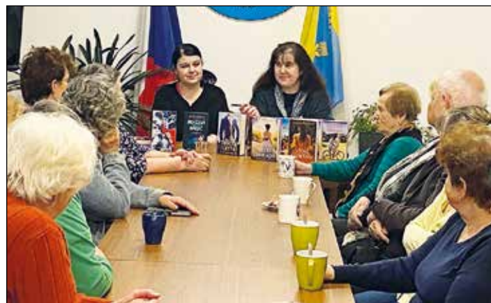
Beseda se spisovatelkami zaujala