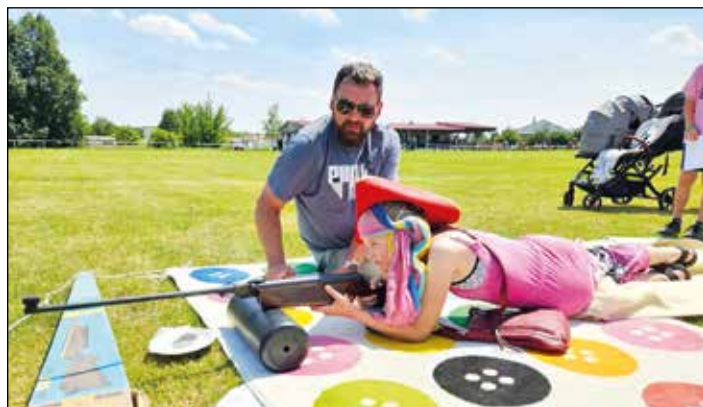
I pirátky umí dobře střílet

Proto jsme rády za všechny, kteří nám s touto akcí moc pomáhají – děkujeme. Vlastní děti nám pomalu odrůstají a je hezké vidět, jak se přirozeně zapojují do příprav akcí, což je někdy baví víc než samotné soutěžení... Letos jsme vymyslely novinku – Vánoční focení. Připravily jsem na sále v Chodounech několik fotokoutků, kam se mohli rodiče s dětmi a jinými příbuznými přijít vyfotit. Bohužel se focení nesetkalo s takovým ohlasem, jaký jsme čekaly. Snad tedy alespoň udělají fotky radost těm, co přišli. Všem přežeme krásný a poklidný zbytek roku. Za Líné matky Eliška Harmanová