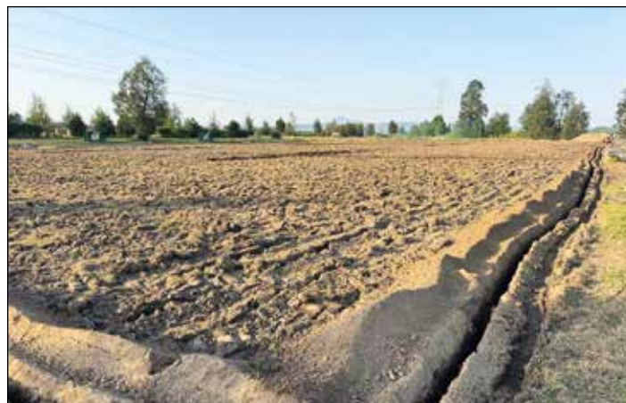
To není pole orné