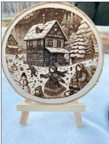
Gravírované poklady z Lounek