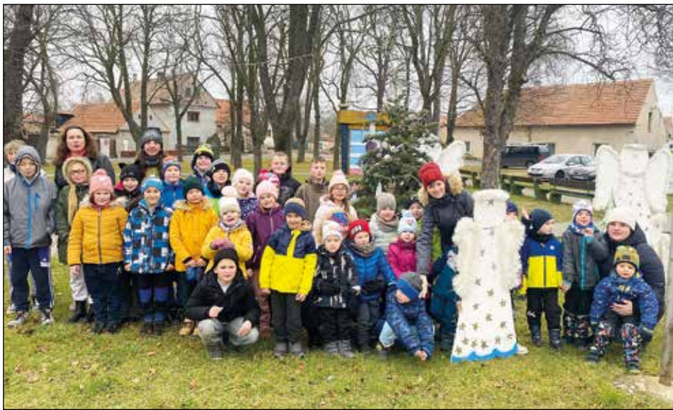
Děti u andělů na návsi v Chodounech