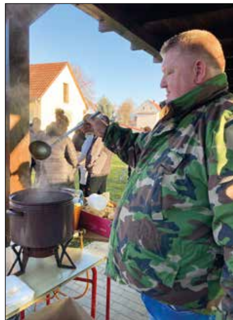
Dršťkovka chutnala i zahřála