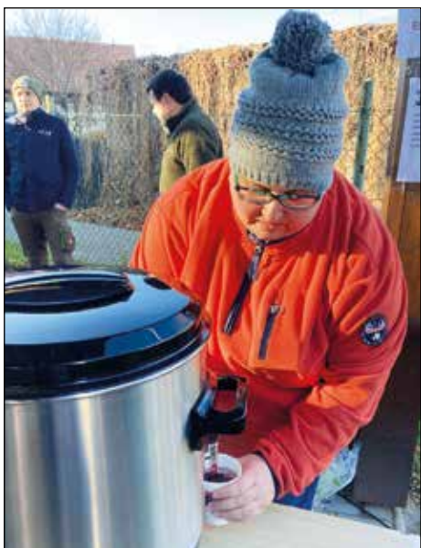
Svařáček nesměl chybět