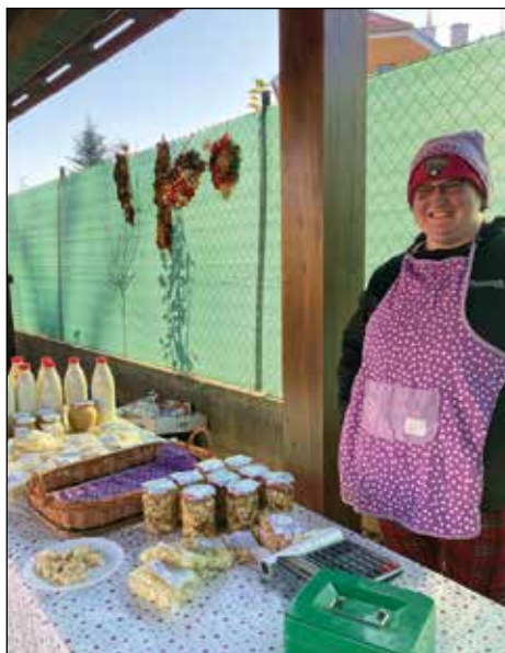
Mlékárna Vědomice nabízí dobroty po celý rok