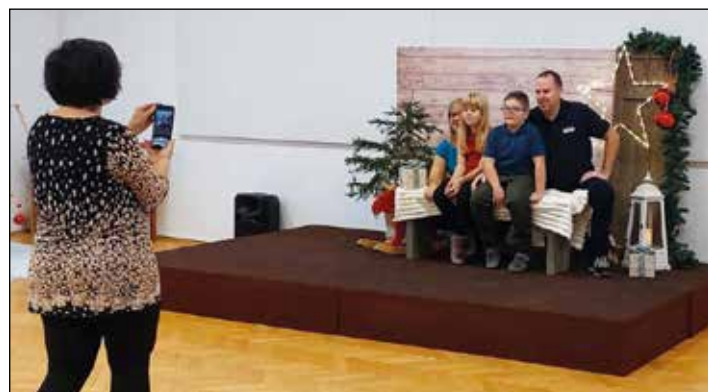
Focení Vánoce 2024