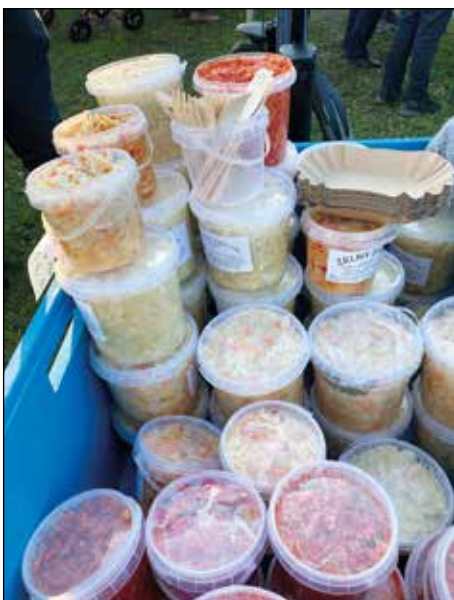
Zdravé Vánoce od Trumpetky