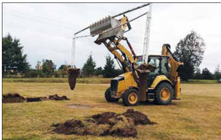
Místo fotbalistů bagr