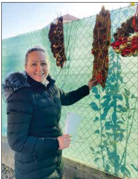
Dekorace od Janičky se brzy rozprodaly